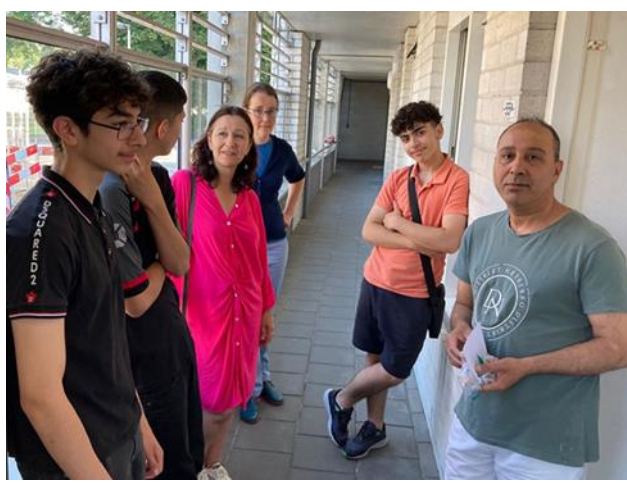
Lief en leed aan de deur met leerlingen van praktijkonderwijs Terra Nigra

Verder ligt in een van onze buurten een school voor praktijkonderwijs. De leerlingen van die school hebben een projectweek Lief & Leed georganiseerd. Zo hebben zij allerlei kleine attenties geknutseld en wafels en cakes gebakken. In juni zijn wij met de gangmakers en met leerlingen van de school, deze attenties gaan uitdelen!